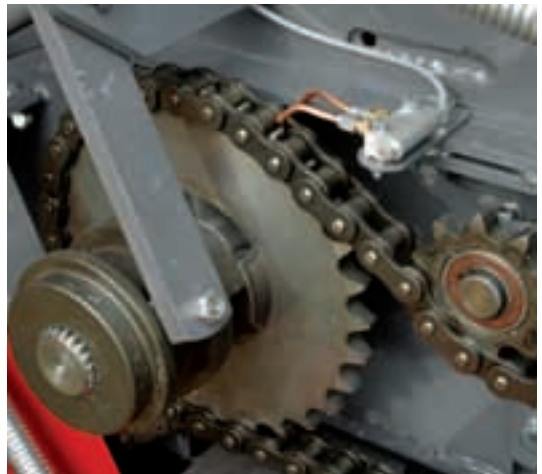
Disinnesto e lubrificazione automatica catene