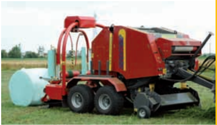
Assale tandem e portafilm