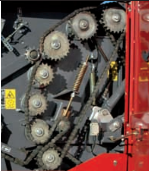
Camera a 16 rulli