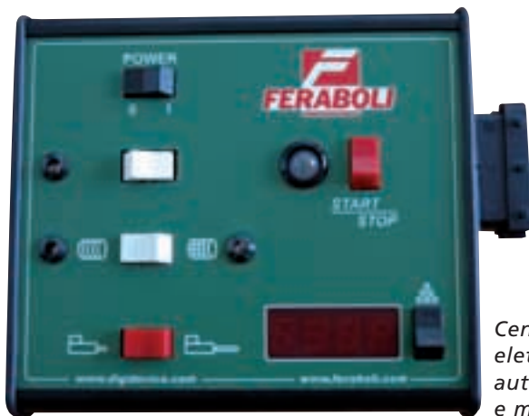
Centralina elettrica automatica e manuale