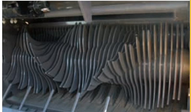
Sistema di taglio Ultracut

L'alta tecnologia applicata a garanzia della massima capacità produttiva. Robusta, con ingranaggi e perni dei rulli temperati Semplice da utilizzare. Adatta per lavorare ogni tipo di terreno. Prestazioni elevate: fino a 50 balle/ora.