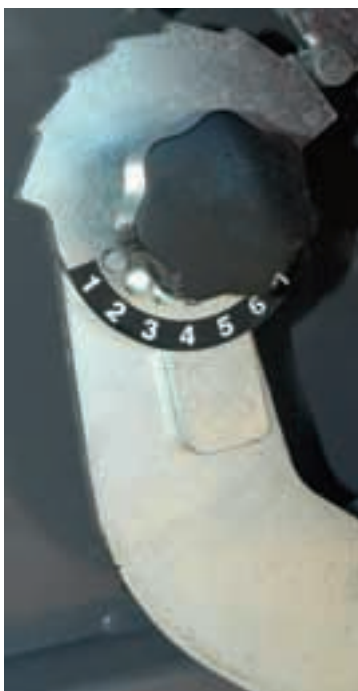
Selettore pressione a 7 posizioni