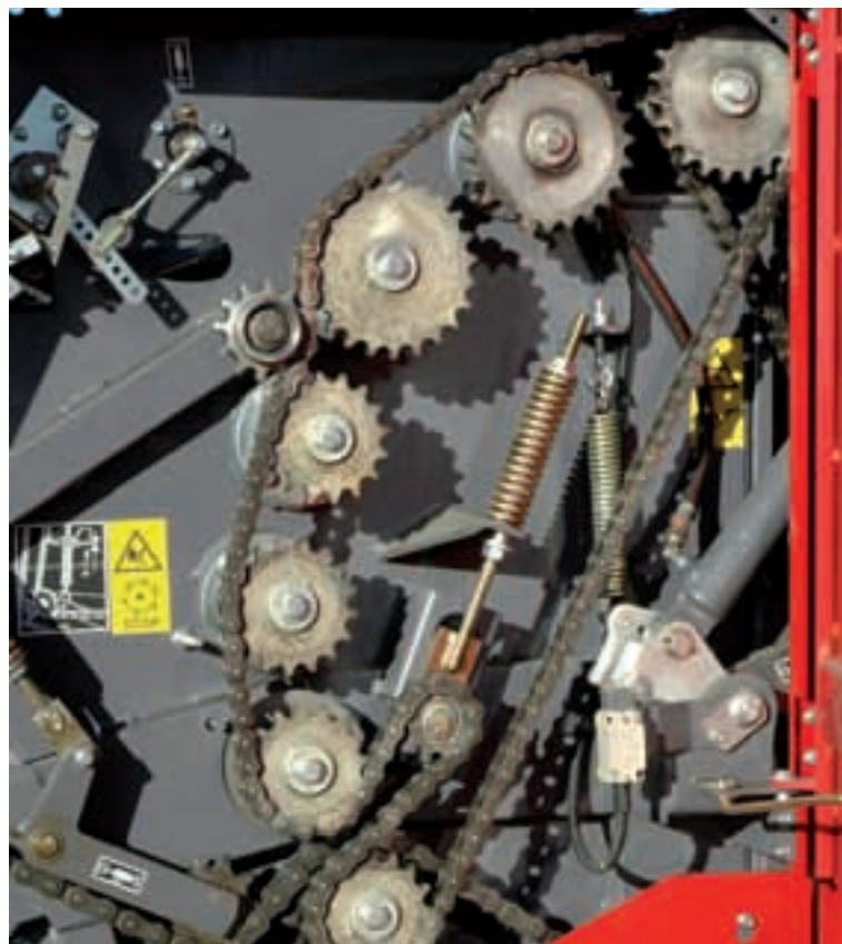
Robusto sistema di trasmissione

L'alta tecnologia applicata a garanzia della massima capacità produttiva. Robusta, con ingranaggi e perni dei rulli temperati Semplice da utilizzare. Adatta per lavorare ogni tipo di terreno. Prestazioni elevate: fino a 50 balle/ora.